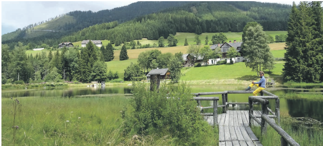
In Hohentauern, entlang des Wasserweges, gibt es viele himmlische Platzerl...