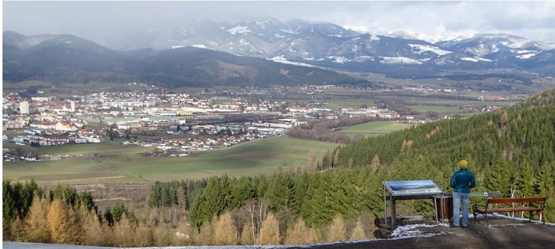
Blick auf Knittelfeld mit den bereits schneebedeckten Seckauer Alpen im Hintergrund.