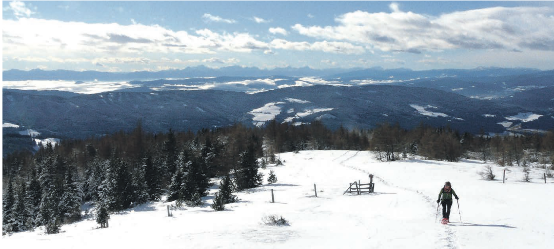
Die freien Flächen bei der Aussichtsplattform Herterhöhe laden zum Schneeschuhwandern ein.